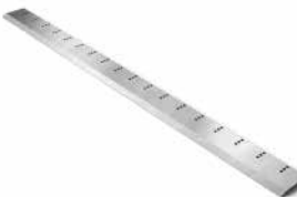
Peeling and slicing knives Луцильные и строгальные ножи