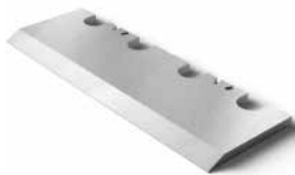
Chipper knives and accessories Рубильные ножи и ножевая оснастка