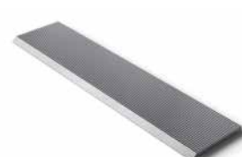
Knives for secondary processing of wood Ножи для вторичной переработки древесины