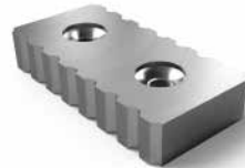
Knives for scrap metal recycling Ножи для резки металлолома