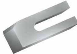
Knives and parts for Sawmills Лесопильный цех