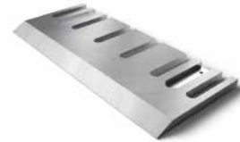
Knives and parts for production of particle boards, MDF and OSB boards Ножи для производства плит ДСП, МДФ и ОСБ